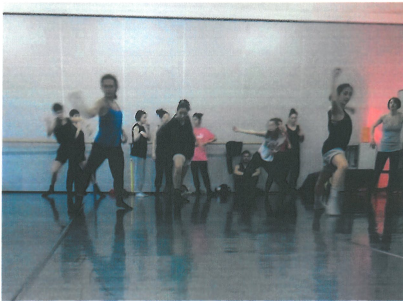
↑攝於義大利 Spellbound Ballet studio:圖為舞團附設舞蹈學校的學生正在學習現代舞小品,授課者為前方身著灰背心的 Spellbound 舞者