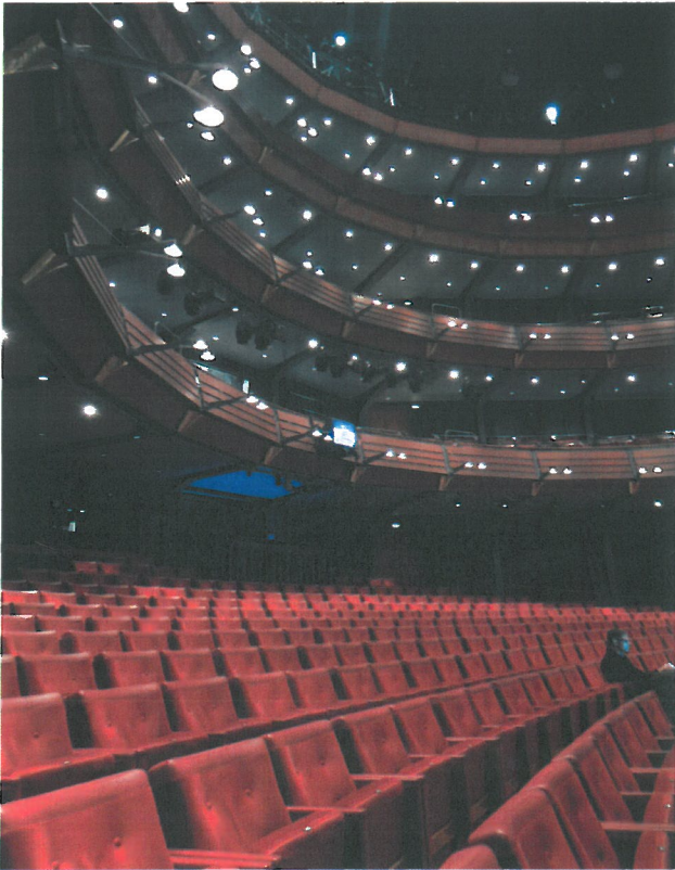
↑ 休息室 (Göteborg Opera ← 觀眾席 )