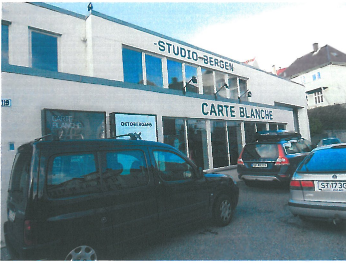
( Carte Blanche 劇場外觀 )