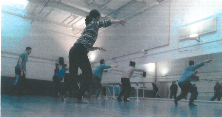
↑攝於瑞士 Bern Ballet studio:上午芭蕾舞課程結束後觀看舞團下午的排練